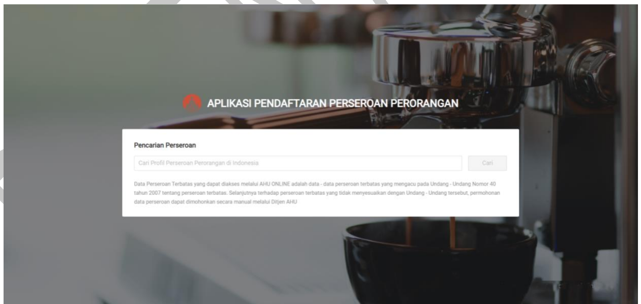
Gambar 80. Pencarian Perseroan