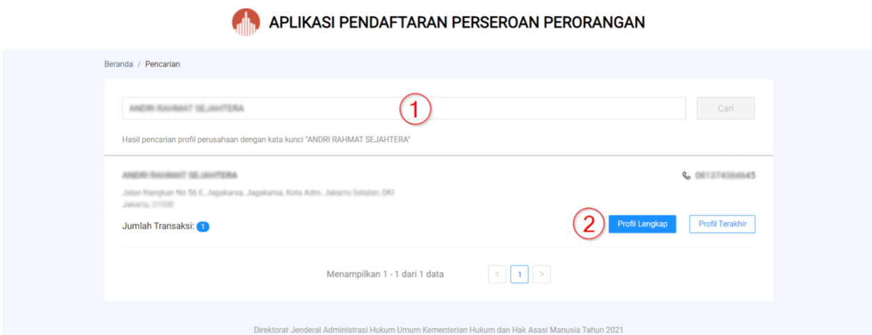
Gambar 81. Hasil Pencarian

B. Kemudian akan tampil hasil dari pencarian seperti gambar berikut: